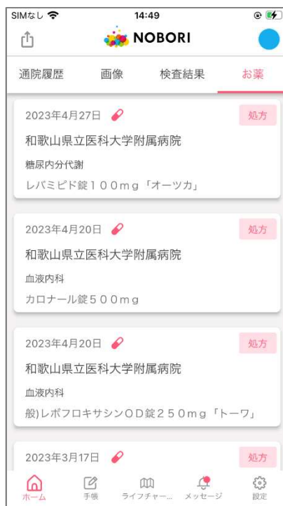
NOBORIアプリのおくすり情報画面